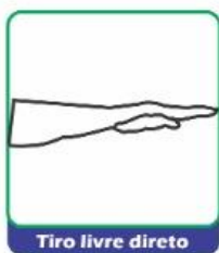
Tiro livre direto