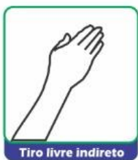
Tiro livre indireto