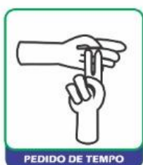
PEDIDO DE TEMPO