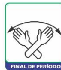
FINAL DE PERÍODO