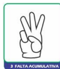
3 FALTA ACUMULATIVA